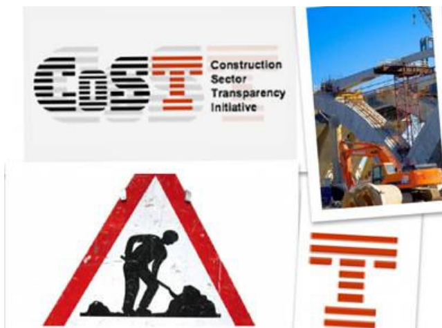
En el evento se debatió sobre cómo mejorar la transparencia en la obra pública

Durante el mes de diciembre integrantes de la Oficina Anticorrupción (OA) asistieron en la en la Ciudad de Guatemala a la Conferencia Regional de Transparencia en Infraestructura.