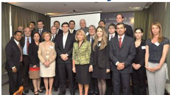
En el encuentro la OA hizo aportes sobre cohecho y peculado, entre otros temas

Durante los días 17, 18 y 19 de diciembre de 2012, la Oficina Anticorrupción (OA) participó activamente de la reunión de trabajo del Grupo de Expertos sobre lucha contra la Delincuencia Organizada Transnacional, de la Conferencia de Ministros de Justicia de los países Iberoamericanos (COMJIB), celebrada en la ciudad de Buenos Aires. En esta reunión, organizada de manera conjunta entre la COMJIB y el Ministerio de Justicia y Derechos Humanos de la República Argentina, participaron altos representantes de la Argentina, Chile, Ecuador, El Salvador, Guatemala, Nicaragua, Panamá, Perú, Portugal, República Dominicana, Uruguay y de la COMJIB.