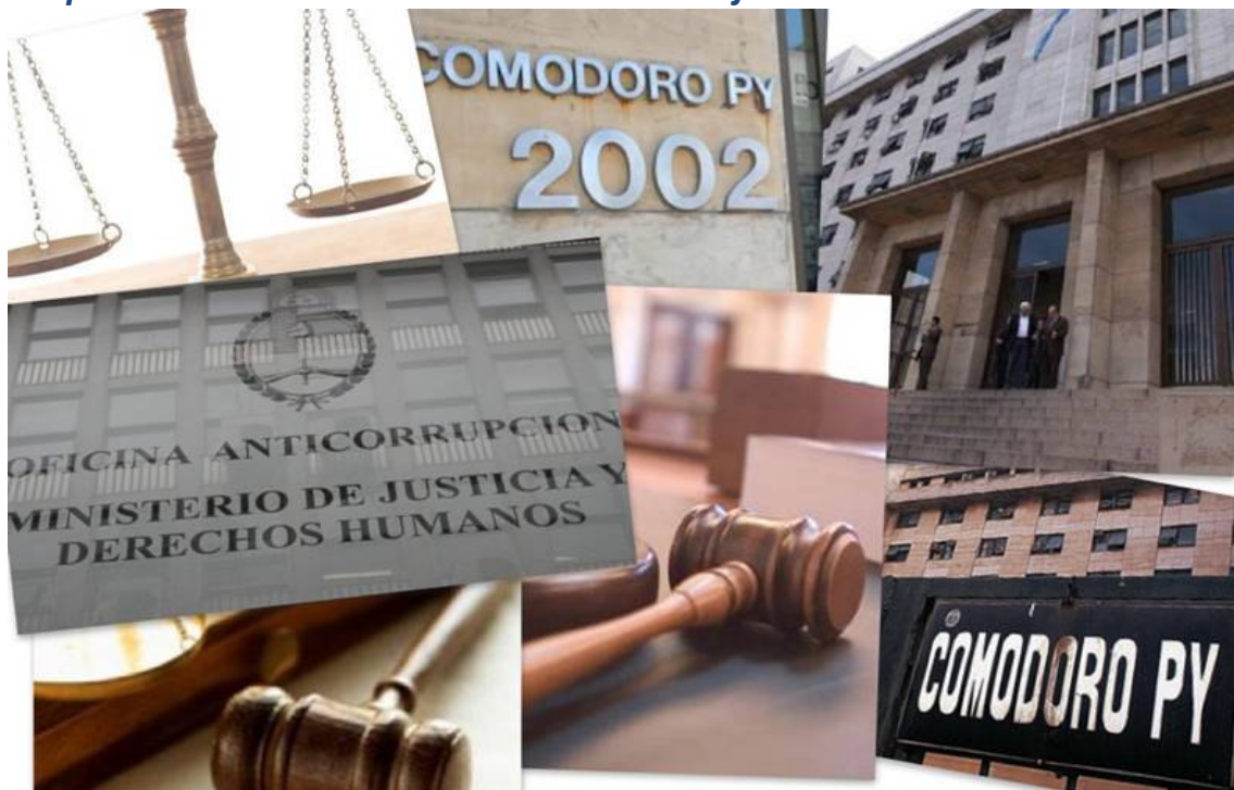
Integrantes de la OA actuarán como querellantes en diversos juicios que se desarrollarán en los Tribunales Federales de Comodoro Py

Luego del receso judicial del mes de enero, la Dirección de Investigaciones de la Oficina Anticorrupción (OA) reinició su actuación ante la justicia en las más de noventa causas donde viene interviniendo como parte querellante. Sobre dicha tarea resulta de especial interés destacar la participación del organismo en las audiencias de debate oral y públicas (es decir, los juicios orales) previstas para desarrollarse durante este año 2013.